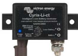
Cyrix-Li-ct 24. 12.-230