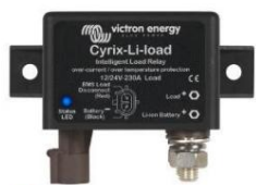
LED indikátor stavu