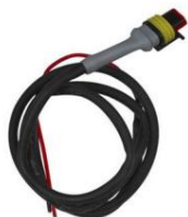
Ovládací kabel pro Cyrix 12/24-230 Délka: 1m

LiFePO4 baterie: prevence pod napětím, přepětím a přehřátím článků První linií ochrany je vyvažování článků. Všechny baterie Victron LiFePO4 mají integrované vyvažování článků.