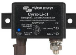
Cyrix-Li-ct 24. 12.-230